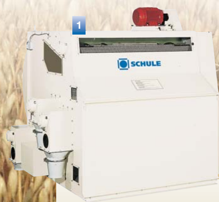
Воздушный сепаратор для точного отделения лузги и ядра