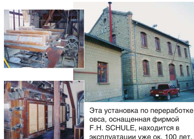
Эта установка по переработке овса, оснащенная фирмой F.H. SCHULE, находится в эксплуатации уже ок. 100 лет.