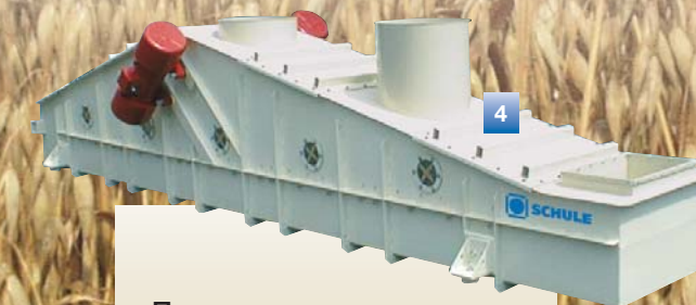
Ленточная сушилка для щадящей и однородной сушки овсяных хлопьев