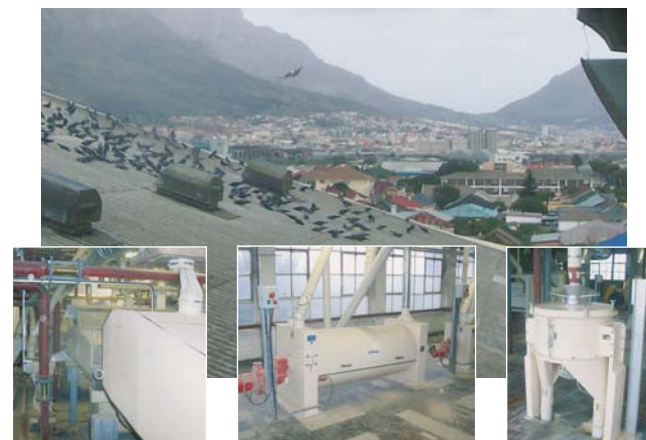
Овсозавод в ЮАР, оснащенный оборудованием фирмы SCHULE в 2006 году