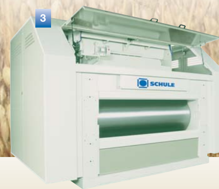
Плющильный станок гибкая и надежная машина, обеспечиваю- щая равномерную толщину хлопьев овса, ячменя, пшеницы и гречихи.